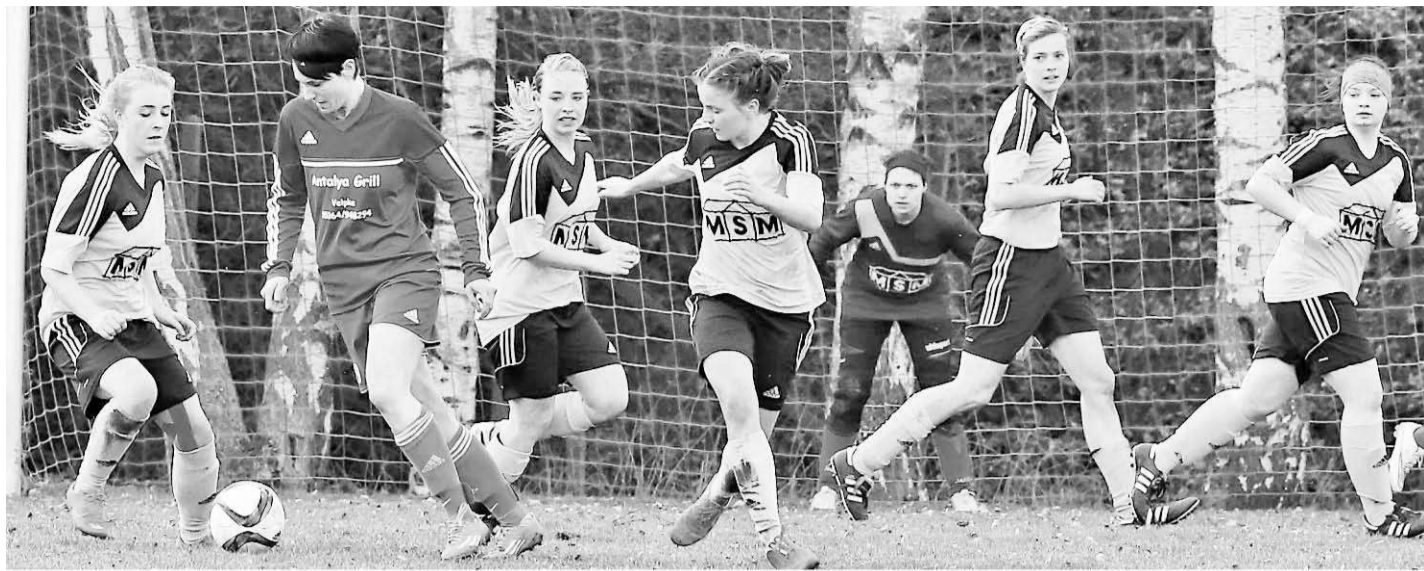
Es geht noch für beide um etwas: Holzland (am Ball) hat die Spitze im Visier, Wahrenholz den Klassenerhalt.