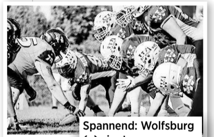
Spannend: Wolfsburg (r.) siegte.